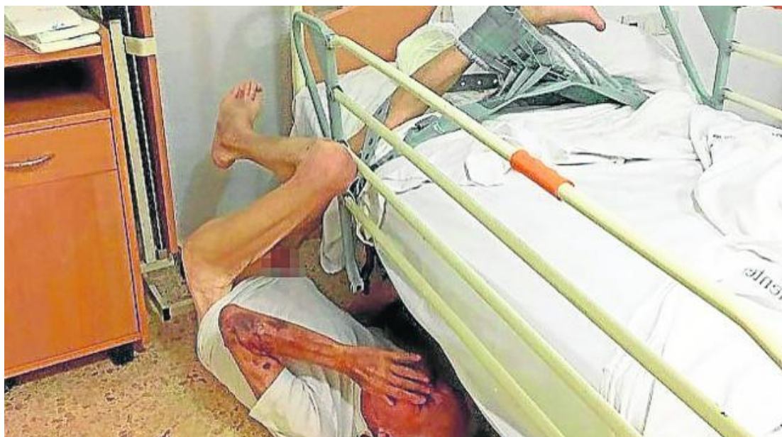
Figura 3. Imagen de paciente contenido que sufre caída desde la cama mostrada durante la entrevista.

Al finalizar la entrevista, se agradecía nuevamente la participación en el estudio y se realizaba un breve resumen de las aportaciones, así como se informaba de qué se haría con los resultados.