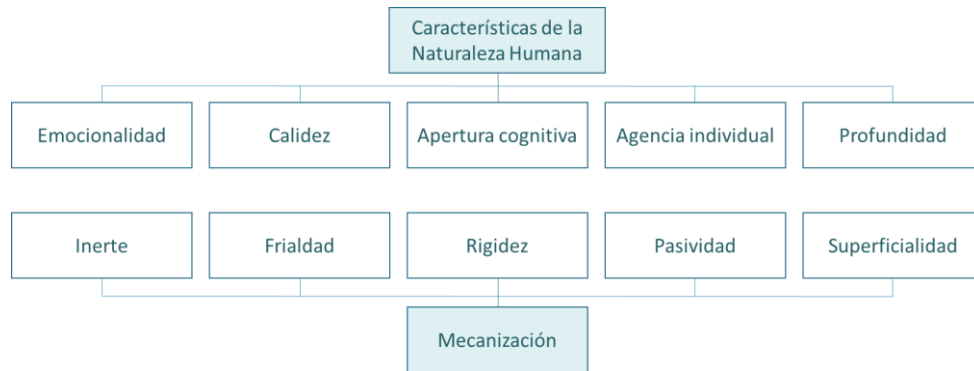
Figura 2. La relación entre las características de NH y la mecanización (adaptado de Haslam (2006) por Martínez (2017)).

La forma mecanicista de la deshumanización se da en diferentes contextos. Por un lado, la medicina moderna es identificada como una actividad deshumanizante al focalizarse en la estandarización, la eficiencia instrumental o la técnica impersonal, (Haslam, 2006). En este ámbito, los pacientes pueden ser deshumanizados por los médicos que los perciben como máquinas compuestas por diferentes piezas que hay que reparar. Por otro lado, esta forma de deshumanización es observada en otros contextos como la industria, la tecnología o en el mundo de los negocios, donde los directivos son comparados con robots. Además, la mecanización queda reflejada en el entorno laboral, donde existen contratos precarios que obligan a gran cantidad de personas a trabajar en condiciones infrahumanas, sin ningún tipo de cobertura en caso de accidente o enfermedad. De esta forma, más que tratados como seres humanos, son percibidos como seres mecanizados o robots sin sentimientos, cuya principal función es la de cumplir su obligación laboral (Martínez et al., 2017). En este contexto, el deseo de interactuar con los grupos mecanizados viene determinado por la instrumentalidad atribuida a los mismos, por lo que las personas sólo se acercan a los grupos que habitualmente deshumanizan cuando perciben cierto grado de utilidad en los mismos (Martínez et al., 2015).